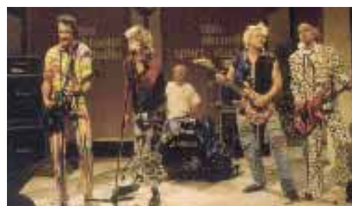
Auftritt im aktuellen Sportstudio.