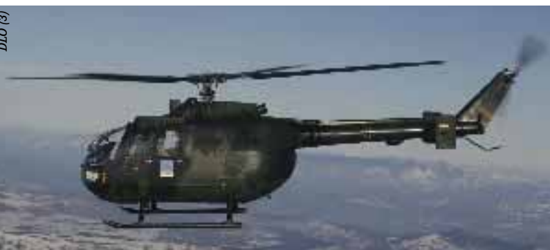
In 10 000 Fuß Höhe: Eine BO-105 im EUFOR-Einsatz über Bosnien-Herzegowina.

Zudem entwickelt sich die in Fritzlar stationierte Luftmechanisierte Brigade 1 zur Luftbeweglichen Brigade. „In diesem Großverband werden erstmals im deutschen Heer Heeresflieger- und Infanteriekräfte in einer Brigade strukturell zusammengeführt. Damit werden Heeresflieger- und Infanteriekräfte im engen Verbund für Einsätze im gesamten Spektrum der Streitkräfte bereitgestellt.“ In diesem Zusammenhang konnte die DLO mehrere Standorte dazu gewinnen, einer davon im unterfränkischen Raum, denn in Hammelburg sind Teile des luftbeweglichen Jägerregimentes stationiert. Insgesamt ist die Division derzeit mit insgesamt 16 Standorten in sieben Bundesländern disloziert.