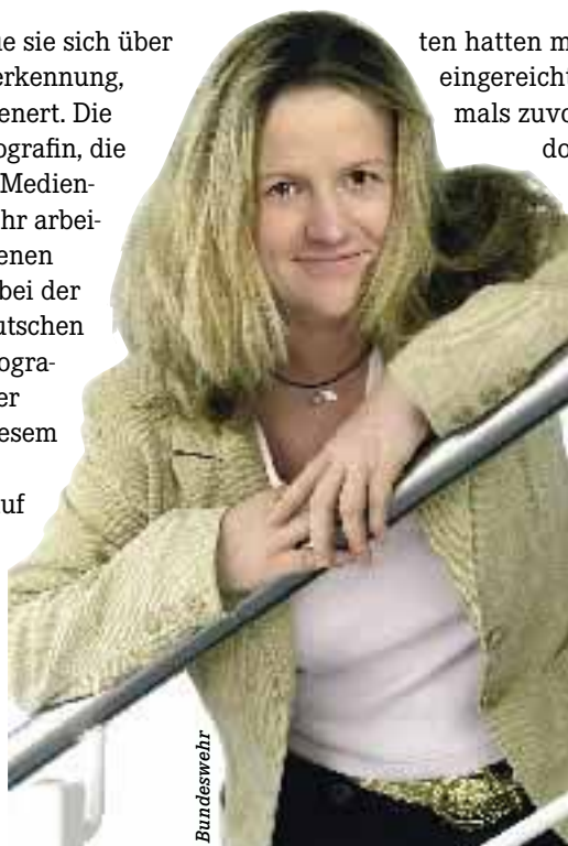
Bundeswehr-Fotografin Andrea Bienert erhielt den Sonderpreis „Das scharfe Sehen“.

ten hatten mehr als 1300 Arbeiten eingereicht. So viel, wie noch niemals zuvor bei diesem höchst-dotierten deutschen Wettbewerb für Bildjournalismus, der zum 23. Mal stattfand.