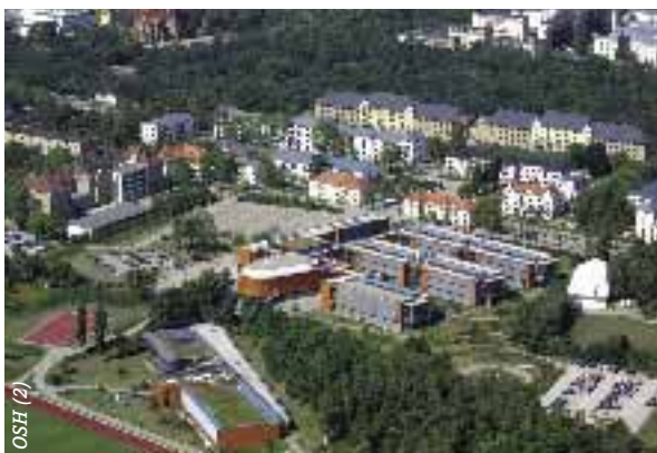
Im Herzen von Dresden: die Offizierschule des Heeres.

Die OSH bleibt die zentrale Ausbildungseinrichtung des Heeres für alle Truppen-, Reserve- und Offiziere des Militärfachlichen Dienstes. Diese werden an der Schule auf ihre Aufgaben als Führer, Ausbil-