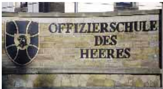
Die OSH: eine der zentralen Ausbildungsstätten.

Am 1. Oktober 2011 kehren die Angehörigen des 76. OAJ zum Offizierlehrgang 2 in die sächsische Landeshauptstadt zurück. Dann ist der erste Ausbildungsdurchlauf neuer Art weitgehend abgeschlossen. Die Auswertung der einzelnen Abschnitte hat aber bereits jetzt begonnen. In den Offizieranwärterbataillonen gewonnene Erfahrungen werden rasch umgesetzt und fließen in die Ausbildung ein. Der enge Kontakt zwischen der OSH und den Verbänden bietet Gewähr, dass im raschen Wechsel der Ausbildungseinrichtungen Reibungsverluste und Ausbildungslücken wo immer möglich vermieden werden.