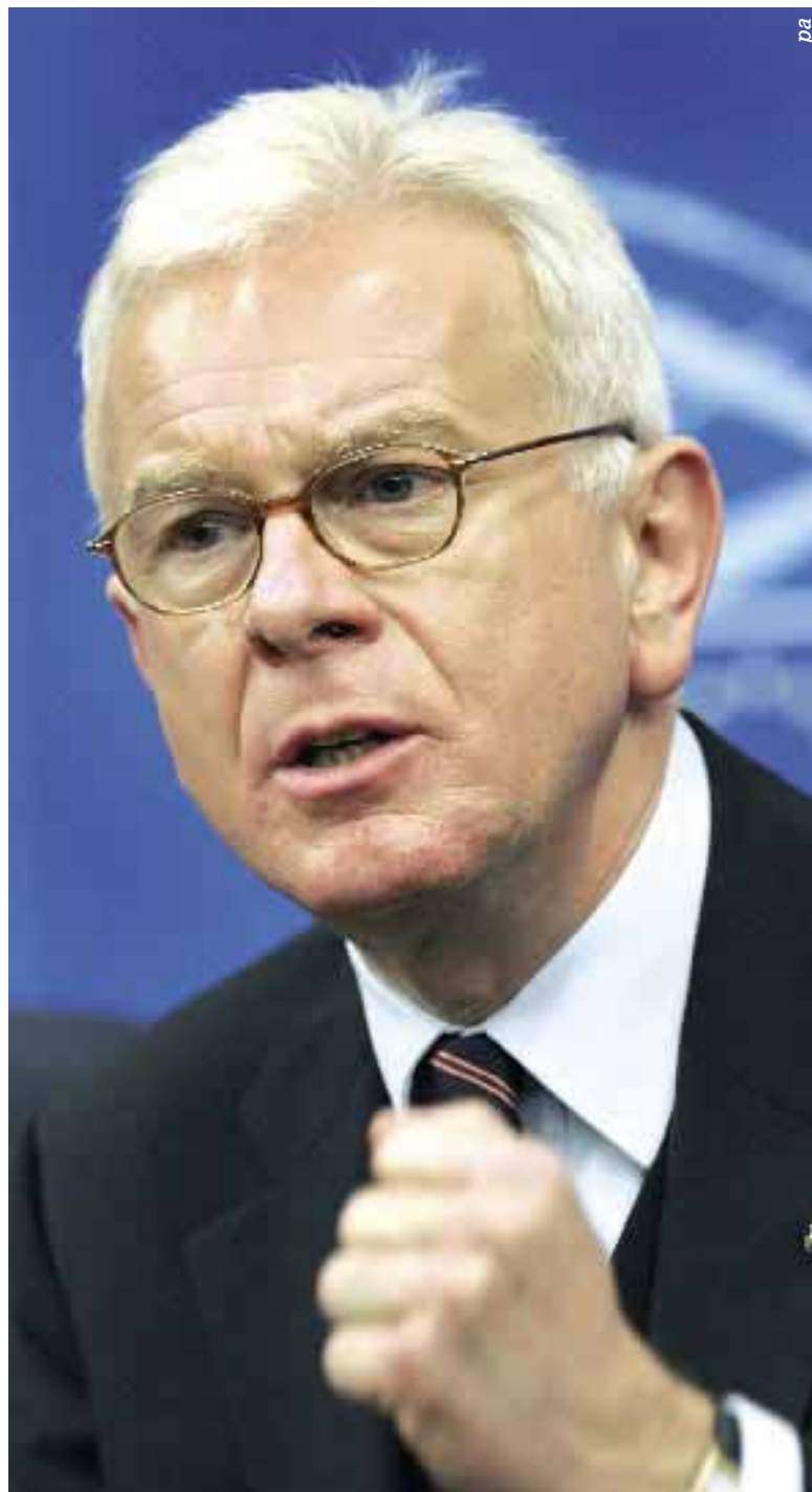
Von Bersenbrück nach Brüssel. Der niedersächsische Christdemokrat Hans-Gert Pöttering gehört dem Europaparlament seit 1979 an.

Pöttering wird Nachfolger des spanischen Sozialisten Josep Borrell und amtiert bis Ende der fünfjährigen Legislaturperiode 2009. Er war seit 1999 Vorsitzender der Fraktion der Europäischen Volkspartei (EVP), der mit 277 Mitgliedern größten Fraktion im Europaparlament. Er ist nach Egon Klepsch und Klaus Hänsch dritter Deutscher in diesem Amt.