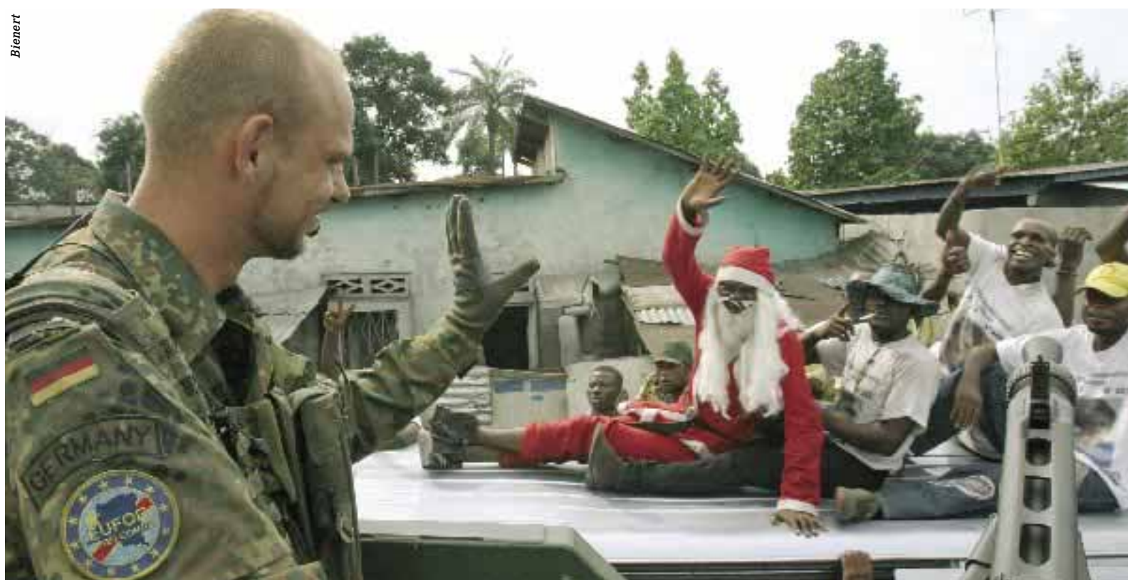
Preisgekrönt: Die Jury des Fotowettbewerbs „Rückblende“ verlieh für dieses Bild den Sonderpreis. Im Dezember erschien es in „aktuell“ als „Bild der Woche“.