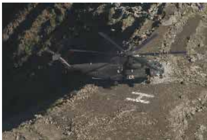
Hilfe aus der Luft: Bei Erdbeben – wie hier in Pakistan – sind Hubschrauber oft die einzige Rettung für die notleidende Bevölkerung.

„Insgesamt wird das Jahr 2007 für uns wiederum von einem fordernden Dreiklang aus Umgliederung, Ausbau unserer Fähigkeiten und Einsatz geprägt sein“, blickte der Divisionskommandeur in die nähere Zukunft. (eb)