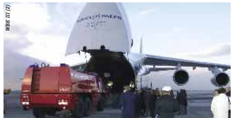
WBK III (2)

Die Firma hält ständig zwei Maschinen am Airport Leipzig bereit, die schnell für Materialtransporte abrufbar sind. Im Bedarfsfall stehen weitere Maschinen nach wenigen Tagen zusätzlich zur Verfügung.