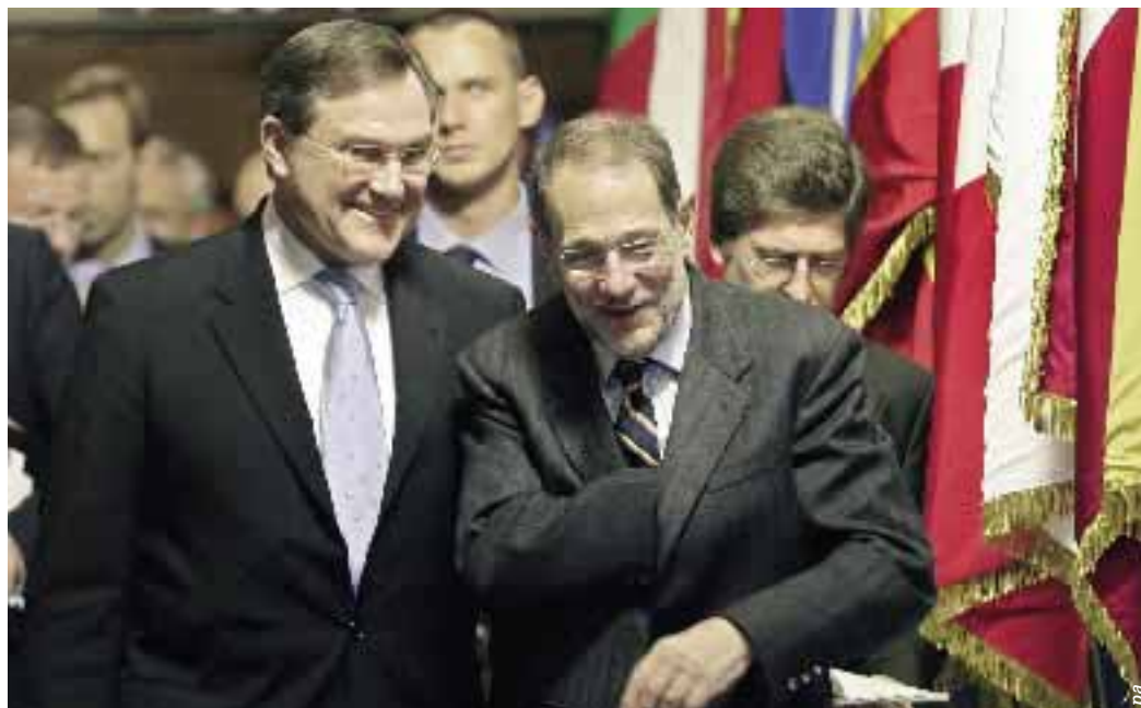
Herzliche Begegnung in Brüssel: Der Hohe Beauftragte für Außen- und Sicherheitspolitik der EU, Javier Solana, und Verteidigungsminister Franz Josef Jung.