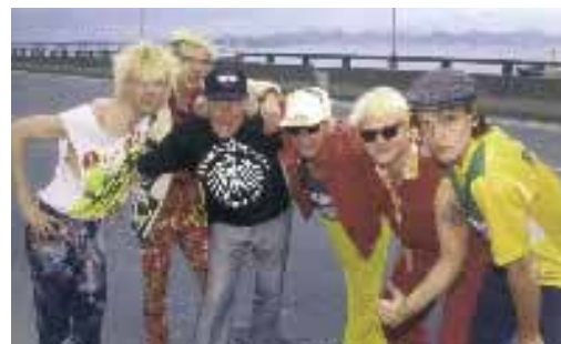
In Rio De Janeiro mit dem Postdieb Ronald Biggs.