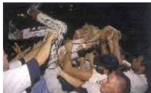
Exzessiv gefeiert: Campino beim „Stagediving“.

Fryderyk Gabowicz: „Die Toten Hosen“; Schwarzkopf&Schwarzkopf 2006; 450 Seiten; 742 Farbfotos; 49,90 Euro; ISBN 3-89602-732-8.