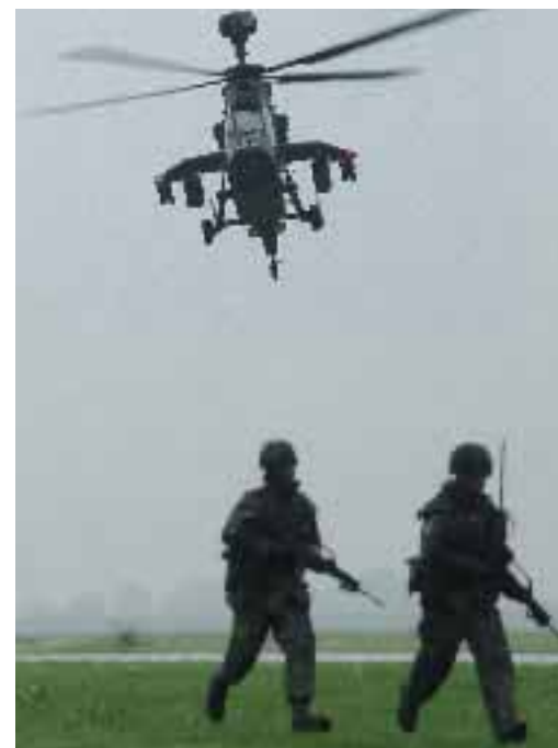
Strukturänderungen bei der DLO durch die Einführung des Kampfhubschraubers „Tiger“.